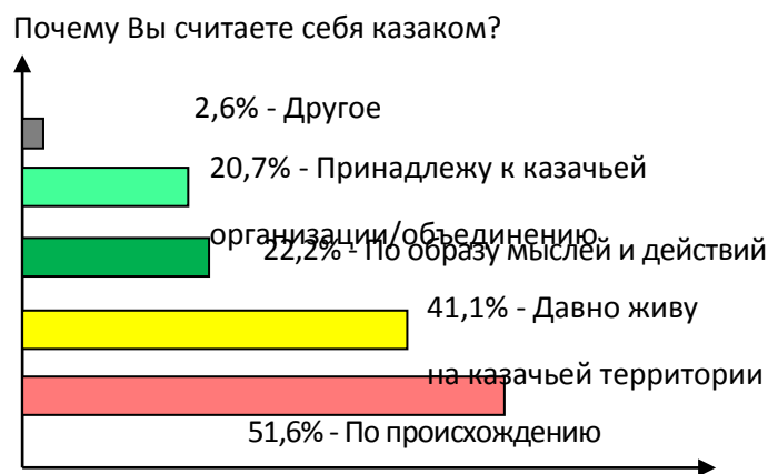
Рис. 3. Основание идентификации

По главной идентификационной категории, в сопряжении с признаками: а) казак /не казак; б) казак/атаман в 2008 г. была картина (см.: рис. 1, 2). Большие различия по категории народ, Умеренные по сословной категории. Одинаковые – по категории социокультурная общность людей [Ефанова, Шишкова, Соклаков, 2008, 43, с. 17]. Кроме субидентификационных элементов, существуют еще и социокультурные основания (см.: рис. 3). Картина идентификации усложняется [Ефанова, Шишкова, Соклаков, 2008, 44, с. 17].