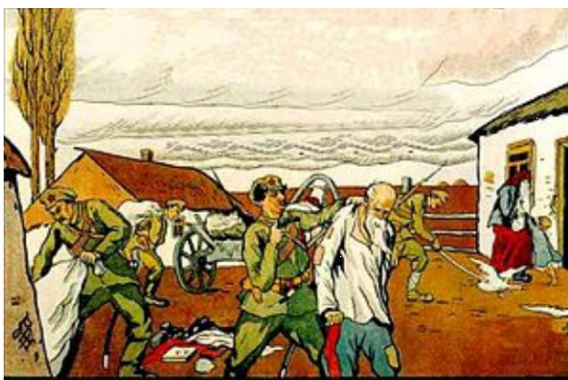
ТАКЪ ХОЗЯЙНИЧАЮТЪ БОЛЬШЕВИКИ ВЪ КАЗАЧЬИХЪ СТАНИЦАХЪ

Расказачивание в ходе коллективизации и раскулачивания. В 1929-1931 гг. вторая волна репрессий — массовые переселения казаков Сибири, Урала и Юга России (300 тыс. репрессированных). Депортации подверглось: на Кубани - 9 тыс. казачьих семей, Черноморский регион - 45 тыс. человек. В современных работах коллективизацию называют – раскрестьяниванием.